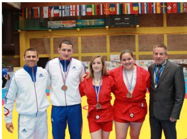
Médailles de bronze

3 médailles de bronze et 4 cinquièmes places.